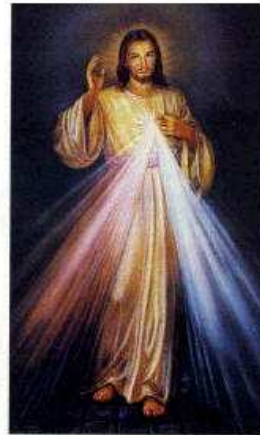
JESUS, J'AI CONFIANCE EN VOUS !